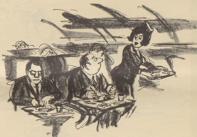
«... essen Sie diesen Spinat nur – unsere Piloten müssen ihn auch essen!»