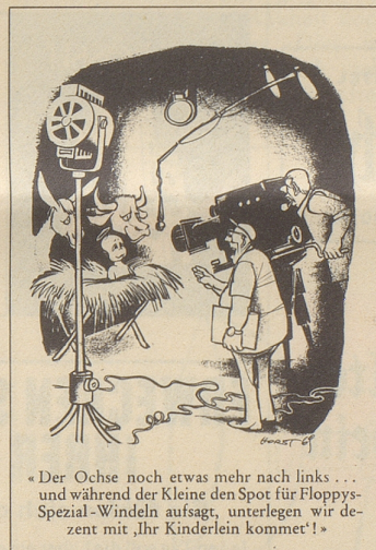
«Der Ochse noch etwas mehr nach links... und während der Kleine den Spot für Floppys Spezial-Windeln aufsaugt, unterlegen wir derzeit mit „Ihr Kinderlein kommet!“»