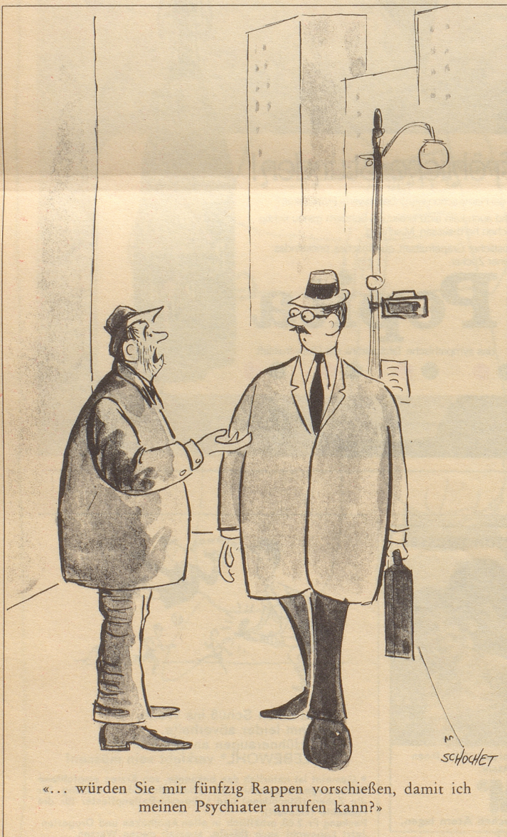
«... würden Sie mir fünfzig Rappen vorschießen, damit ich meinen Psychiater anrufen kann?»