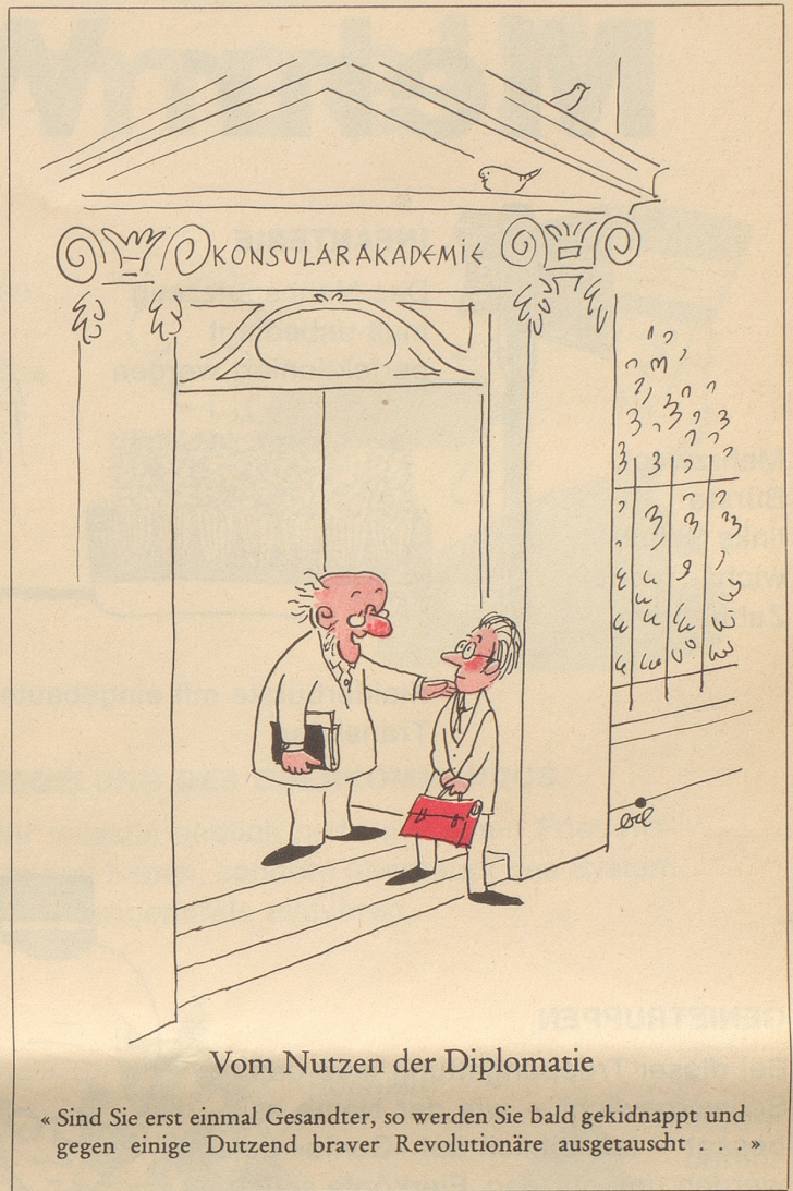
Vom Nutzen der Diplomatie

«Sind Sie erst einmal Gesandter, so werden Sie bald gekidnappt und gegen einige Dutzend braver Revolutionäre ausgetauscht ...»