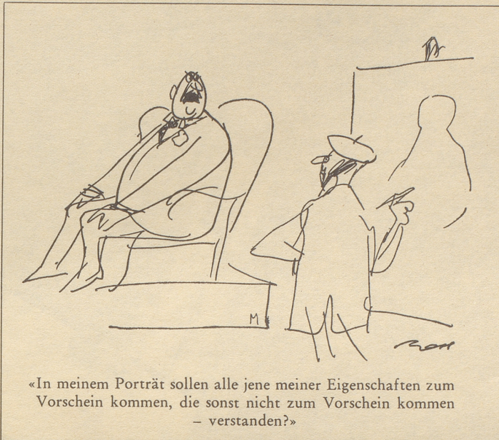
«In meinem Porträt sollen alle jene meiner Eigenschaften zum Vorschein kommen, die sonst nicht zum Vorschein kommen – verstanden?»