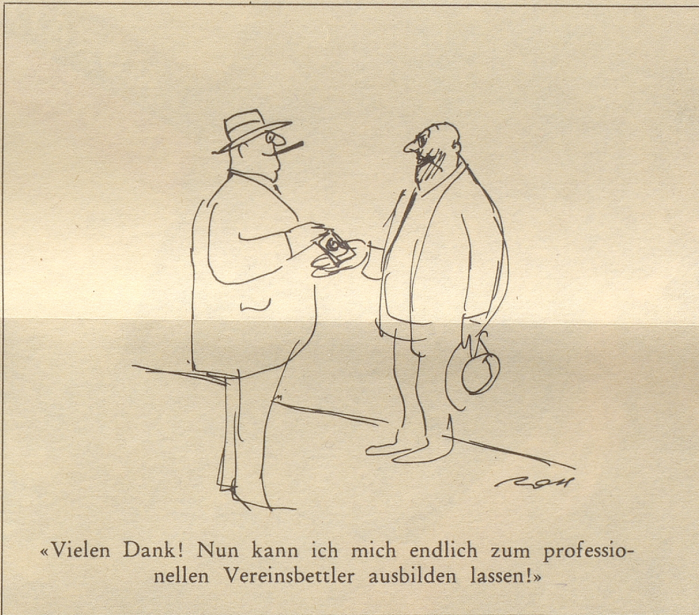
«Vielen Dank! Nun kann ich mich endlich zum professionellen Vereinsbettler ausbilden lassen!»