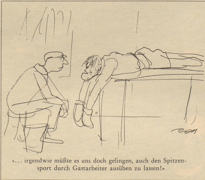
«... irgendwie müßte es uns doch gelingen, auch den Spitzensport durch Gastarbeiter ausüben zu lassen!»