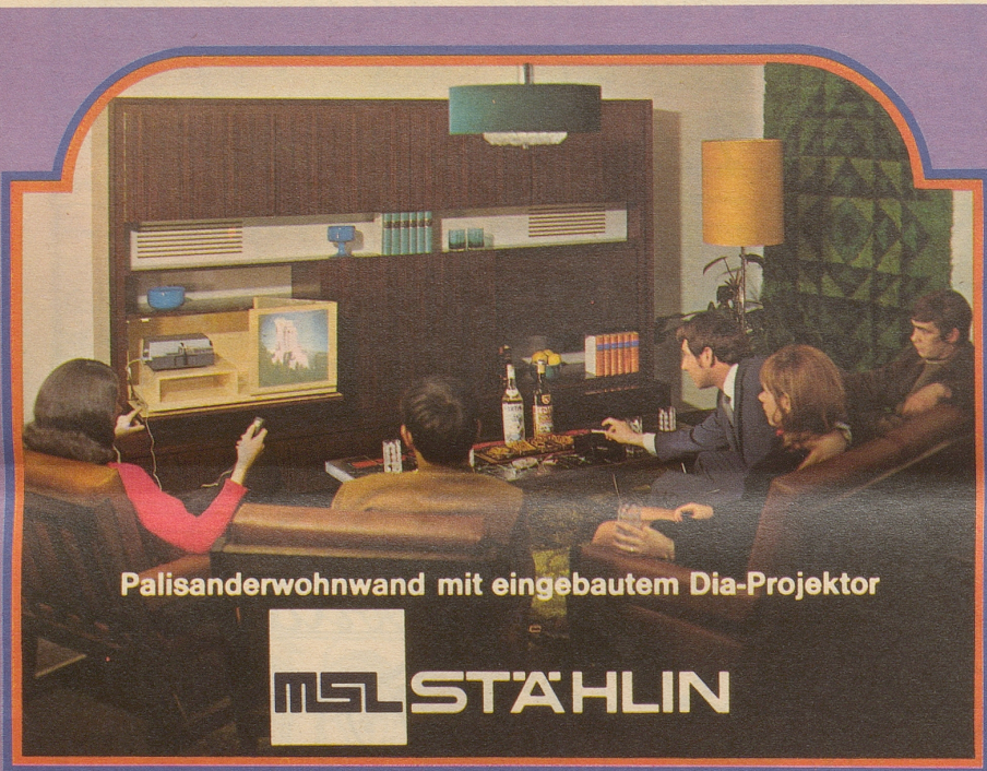
Palisanderwohnwand mit eingebautem Dia-Projektor

In der Sendung «Fifi-Küsse» sagte Hanns Dieter Hüsch: «Mehrere Blockflöten im Haus ersparen den Psychiater auf dem Dach ...» Ohohr