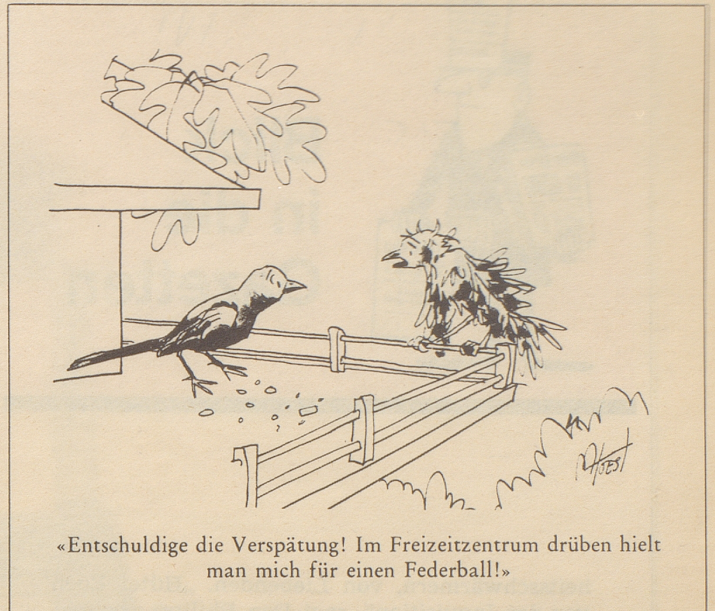
«Entschuldige die Verspätung! Im Freizeitzentrum drüben hielt man mich für einen Federball!»