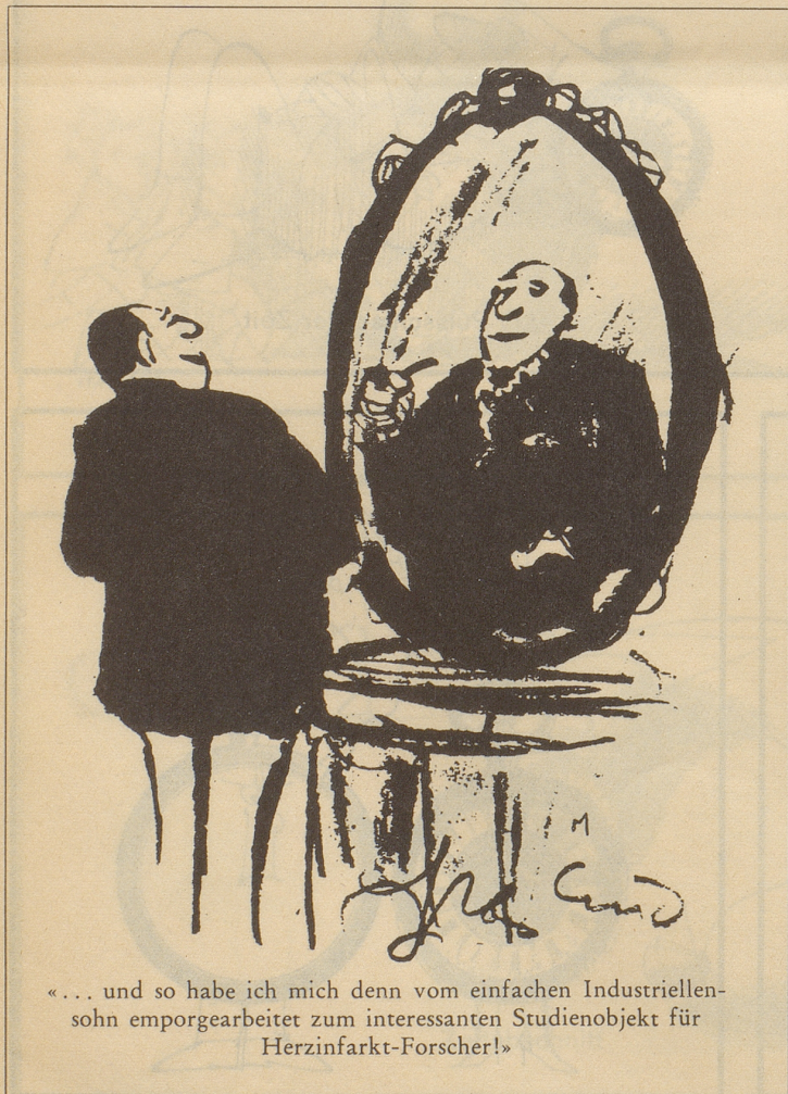
«... und so habe ich mich denn vom einfachen Industriellensohn emporgearbeitet zum interessanten Studienobjekt für Herzinfarkt-Forscher!»