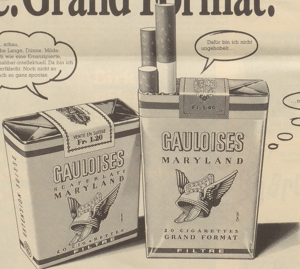
Die neue Gauloise Gelb Filter. Grand Format. Milder Maryland-Tabak. Fr. 1.40.