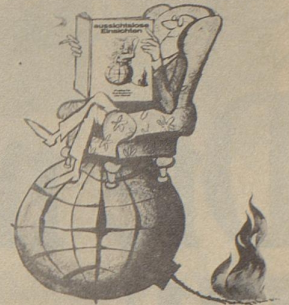
Politische Karikaturen von Horst