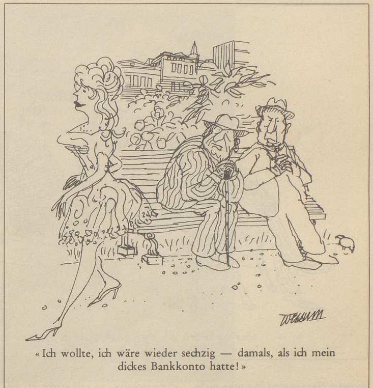
«Ich wollte, ich wäre wieder sechzig - damals, als ich mein dickes Bankkonto hatte!»

«... So - kann fast alles bedeuten, wird aber gewöhnlich dann gebraucht, wenn eine Unterhaltung einzuschlafen droht, um zu beweisen, daß die Gesprächspartner nicht