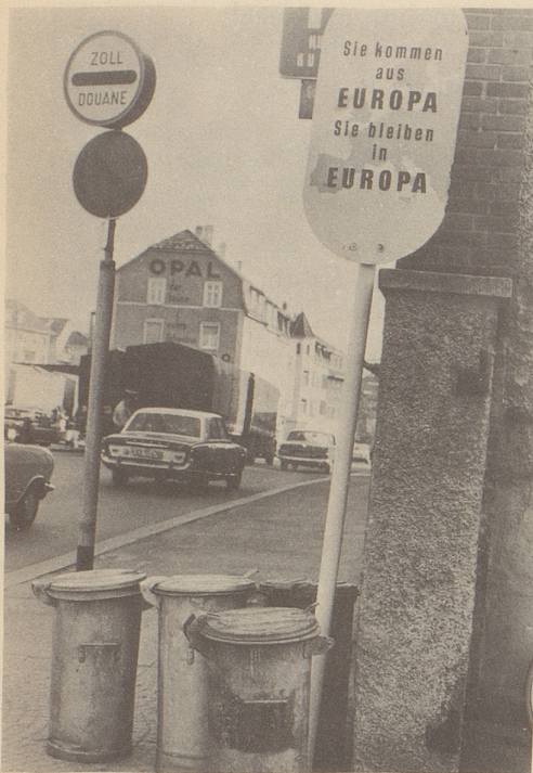
Ein Schnappschuß beim Grenzübertritt

Offen gestanden, ich hatte einige Mühe, den Text auf der Tafel beim Grenzübertritt Lörrach–Basel richtig zu verstehen: «Sie kommen aus Europa, Sie bleiben in Europa.» Eine Begrüßung des Ankommenden war es nicht, eine Warnung natürlich auch nicht! Eine Feststellung? Aber wozu? Immerhin, das Wort «europäisch» sprach mich sympathisch an, weil ich gerne ein Europäer bin. Also indirekt doch eine Art Begrüßung! Aber dann mußte ich überrascht lächeln, denn beinahe wäre ich gestolpert: über die Kehrichtkübel, die mir den Weg aus Europa versperrten, um in Europa zu bleiben.