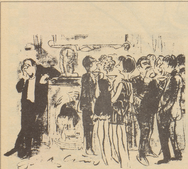
«... das ist entweder ein Poet mit Weltschmerz oder der Trainer der Schweizer Damen-Skinationalmannschaft...»