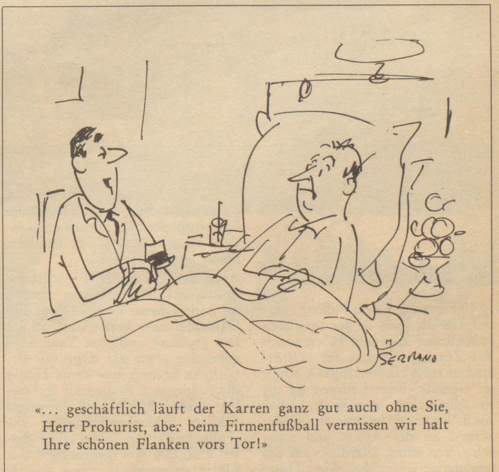
«... geschäftlich läuft der Karren ganz gut auch ohne Sie, Herr Prokurist, aber beim Firmenfußball vermissen wir halt Ihre schönen Flanken vors Tor!»

«Er chunnt scho! Hämmer de Plan für di neu Schtarpiste im Fall er wider wott furt?»