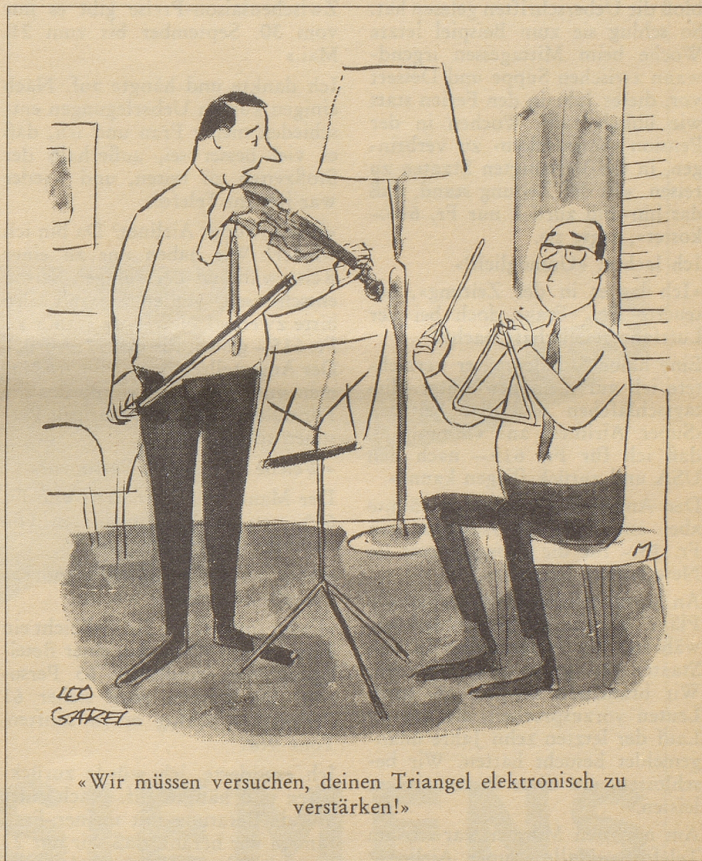
«Wir müssen versuchen, deinen Triangel elektronisch zu verstärken!»