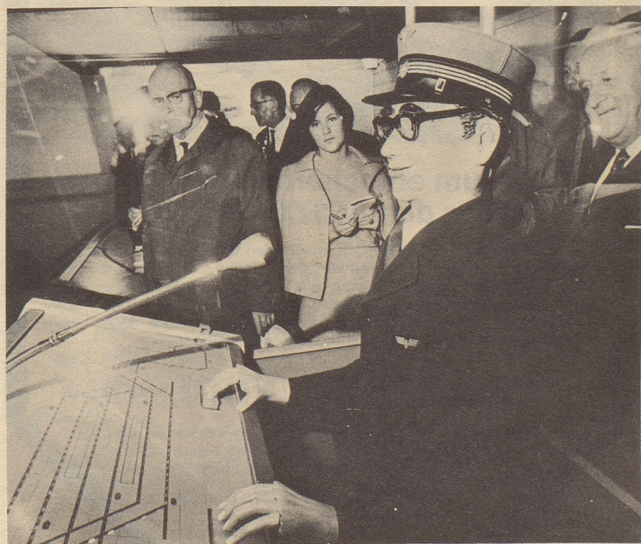
Roboter-Bahnhofsvorstand Robi Otter in der Zürcher «Morgensonne».

Uebrigens gehört zu Zürich auch beim Zoo in der «Morgensonne» eine öffentlich zugängliche Modelleisenbahn mit Alpenglühen, Viertausendern, Vieh, Seen und namentlich mit Europas erstem elektronischen Bahnhofsvorstand namens Robi Otter (also: Roboter), der die Tasten bedient, die Lippen beim Reden in drei Sprachen bewegt und überdies sowohl auf freie Tage als auch auf Ferien verzichtet.