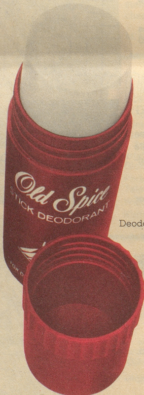
Deodorant-Stick ab Fr. 4.40