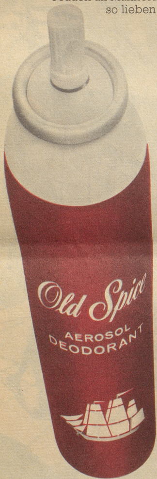
Deodorant-Aerosol zu Fr. 7.80/9.-