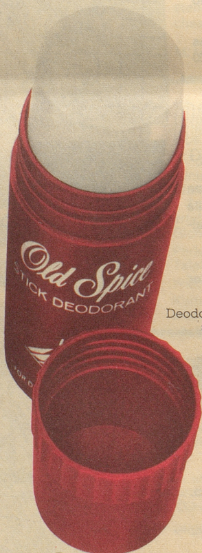
Deodorant-Stick ab Fr. 4.40