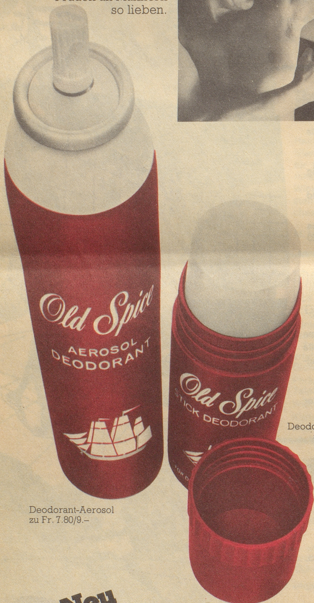
Deodorant-Aerosol zu Fr. 7.80/9.-