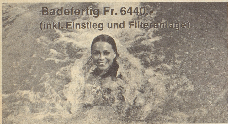
Badefertig Fr. 6440.- (inkl. Einstieg und Filteranlage)

Das problemloseste Schwimmbad, speziell für Schweizer Verhältnisse entwickeltes Baukastensystem. 12 besonders preiswerte Typen dank unserer Erfolgsformel: Standardmasse = Standardpreise