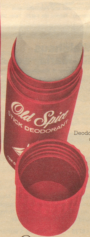
Deodorant-Stick ab Fr. 4.40