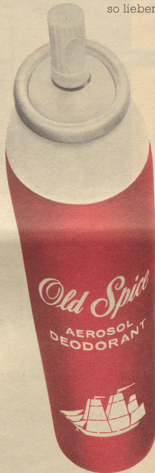
Deodorant-Aerosol zu Fr. 7.80/9.-