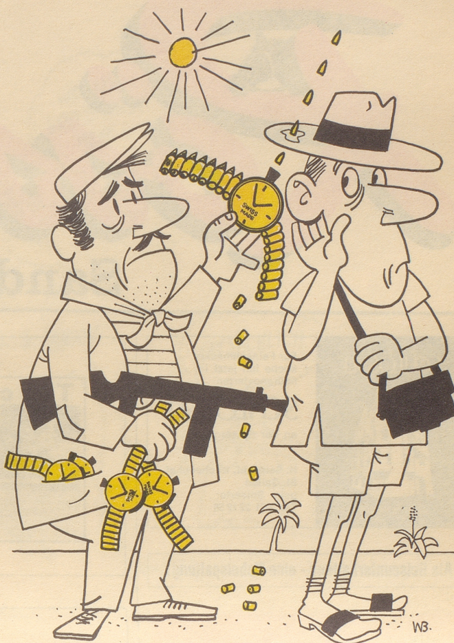
Die Mafia fälscht Schweizer Uhren