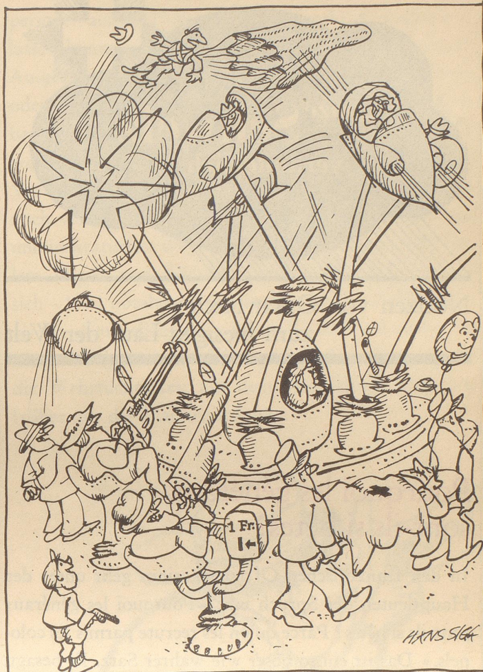
Internationaler Schaustellerkongress in Zürich

Die Sportlernationen reiben sich jetzt schon die Hände: 365 Gold-, 365 Silber- und 382 Bronzemedailen werden vom 26. August bis 10. September 1972 an den Olympischen Spielen in München zu holen sein.