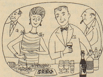
Am Party-Buffer darf er nicht fehlen, den beliebte gehaltvolle Traubensaft