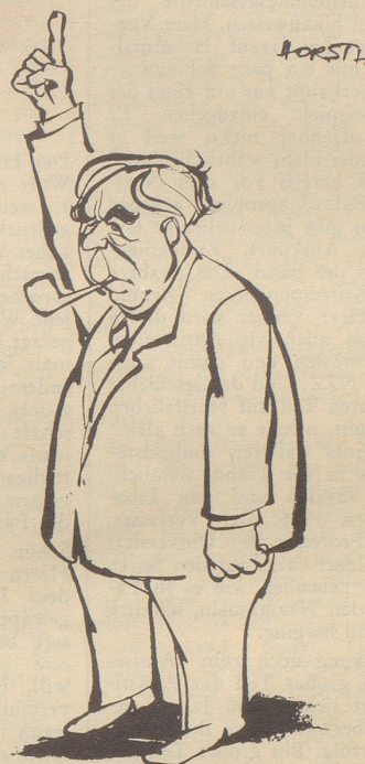
Harold Wilsons Entscheid in Sachen EWG