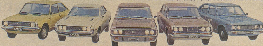
Corolla 1200 Sedan, ab Fr. 7400.-

TOYOTA AG, Generalvertretung für die Schweiz, Bernstrasse 127, 8902 Zürich-Urdorf, Telefon 01 984343. Über 250 Vertretungen in der ganzen Schweiz.