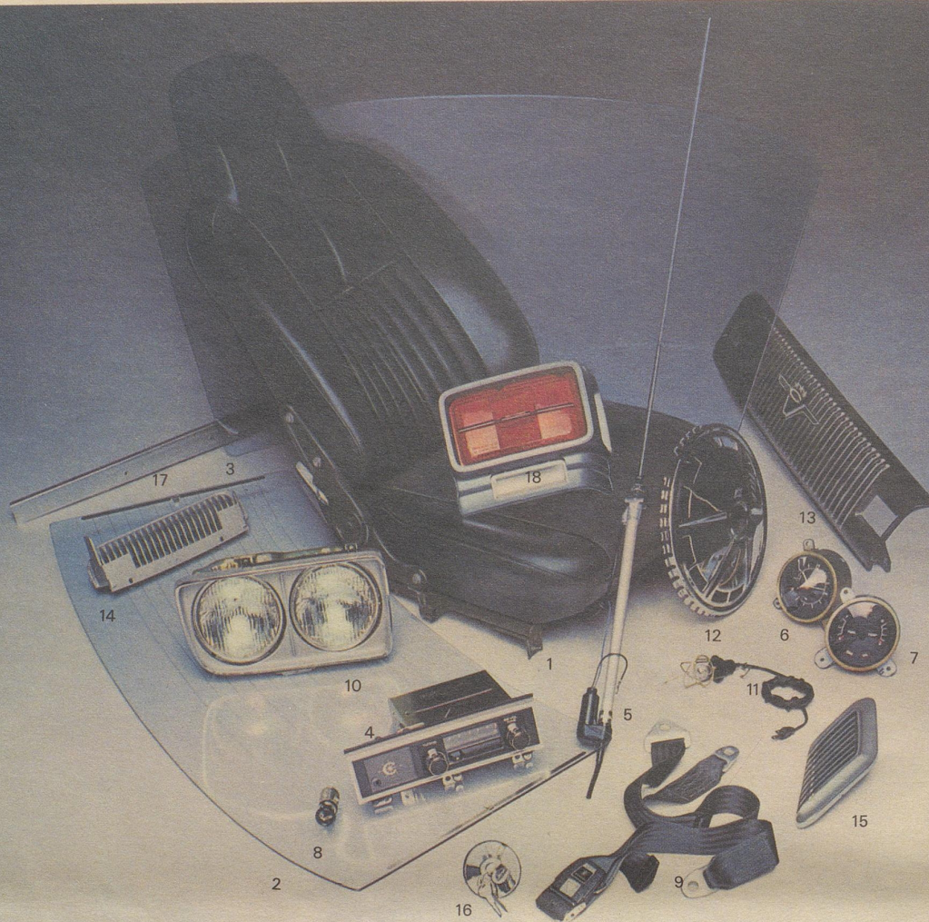
1 Einzelligesitze mit eingearbeiteten Kopfstützen 2 Heckscheibenheizung 3 Getönte Scheiben 4 Leistungsstarker MW-Radio 5 Halbautomatisch ausfahrbare Antenne 6 Elektrische Uhr mit grossem Sekundenzeiger 7 Elektrische Anzeigekombination für Benzinstand, Temperatur und Ölkontrolle, mit Handbremswarnlicht 8 Zigarettenanzünder 9 Dreipunkt-Sicherheitsgurten 10 Doppelscheinwerfer 11 Pannlampe mit langem Kabel 12 Luxus-Radzierdeckel verchromt 13 Kühlergrill aus Kunststoff (leicht auswechselbar) 14 Frischluftgrill aus Kunststoff (leicht auswechselbar) 15 Entlüftunggrill aus Kunststoff (leicht auswechselbar) 16 Benzintankdeckel mit Schloss 17 Türschwellschutz aus Kunststoff oder nicht rostendem Leichtmetall 18 Grosszügige Heckleuchtenkombination mit Kunststoffeinfassung (leicht auswechselbar)