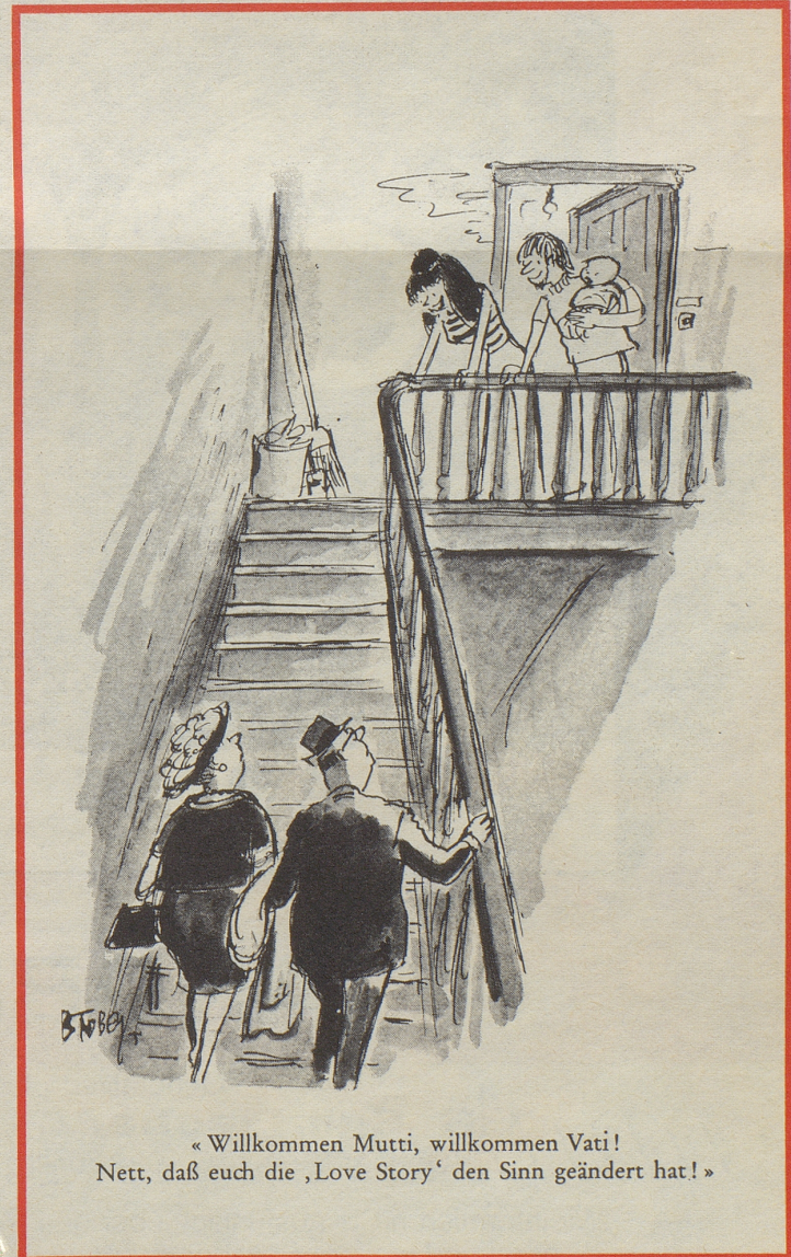
« Willkommen Mutti, willkommen Vati! Nett, daß euch die ‚Love Story‘ den Sinn geändert hat! »