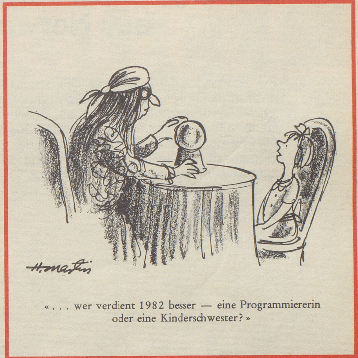
« . . . wer verdient 1982 besser — eine Programmiererin oder eine Kinderschwester? »

Die Moskauer «Komsomolskaja Prawda» wünscht bessere Information für die Zeitungsleser und schrieb am 29. Mai: «Die Presseberichte müssen offener die unvorteilhaften Aspekte und Entwicklungen in unserer Gesellschaft behandeln. Es ist für uns besser, wenn wir selbst diese Aspekte analysieren, als daß wir auf die Kommentare der verschiedenen westlichen Radiostationen warten, welche auf dem einen oder anderen Weg, direkt oder indirekt, unser Publikum erreichen. Unsere Berichte über Ereignisse im Westen andererseits sollten weniger oberflächlich sein. Ausführungen über die «fletschenden Zähne des Imperialismus» vermögen viele Leute heute nicht mehr zu beeindrucken. Wir müssen für unsere jungen Leute die Dinge gründlicher analysieren.»