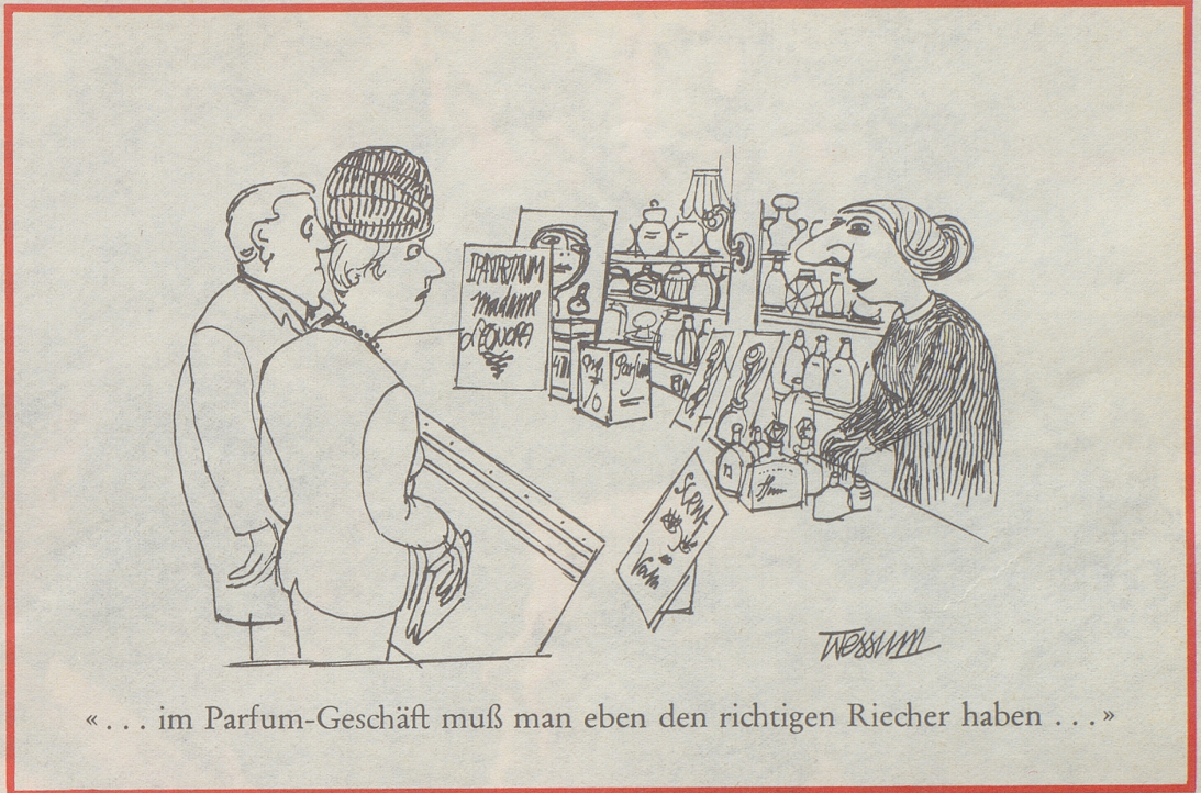
«... im Parfum-Geschäft muß man eben den richtigen Riecher haben ...»

Der frühere westdeutsche Innenminister Höcherl fand bissige Worte über den neuen «Super-Wirtschafts- und Finanzminister» Schiller: «Im Vergleich zu Professor Schillers Konjunkturprognosen hat selbst die griechische Pythia die Aussagen eines Computers geliefert.» TR