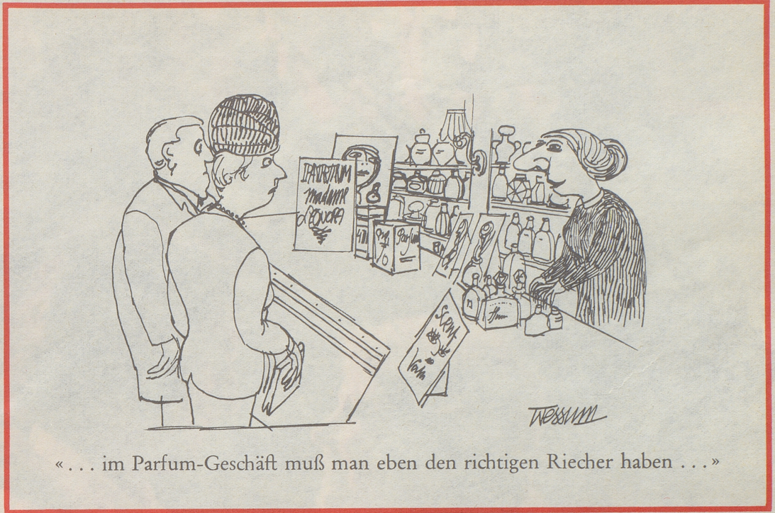
«... im Parfum-Geschäft muß man eben den richtigen Riecher haben ...»

Der frühere westdeutsche Innenminister Höcherl fand bissige Worte über den neuen «Super-Wirtschafts- und Finanzminister» Schiller: «Im Vergleich zu Professor Schillers Konjunkturprognosen hat selbst die griechische Pythia die Aussagen eines Computers geliefert.» TR