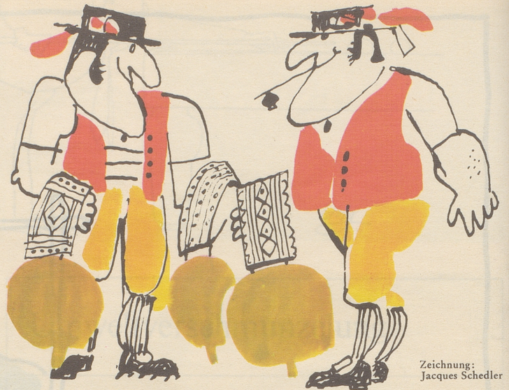
Zeichnung: Jacques Schedler

Schlagfertig oder/und witzig – ich glaube nicht, daß damit das Wesentliche erfaßt wird. Könnte es nicht sein, daß die witzartigen