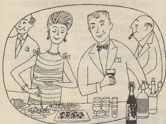
Am Party-Buffer darf er nicht fehlen, der beliebte gehaltvolle Traubensaft

Es ist nicht damit getan, heute um den Umweltschutz einen großen Rummel zu veranstalten, der am Tage nach der Wahl stillschweigend abgeprotzt wird. «Der Worte sind genug gewechselt, laßt mich auch endlich Taten sehn!» sagt Goethe ganz vorne im Faust; was übrigens, laut Ovid, schon Ajax zu Ulysses gesagt haben soll. Unsere Leserin stellte eine Frage – und gewiß nicht sie allein: «Ich habe kleine Kinder – ist es nicht zum Weinen mit dem Gift in der Milch?» AbisZ