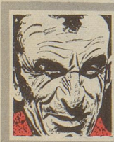
Usem Innerrhoder Witztröckli