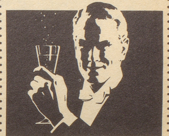
Ihr Sekt für frohe Stunden