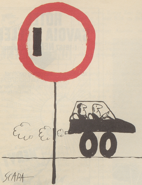
Die «sichere» Geschwindigkeit