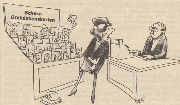
«Eine hat mich soeben gebissen!»

Viele Jahre lang hat er mir eifrig geholfen, gute Süppchen, Braten,