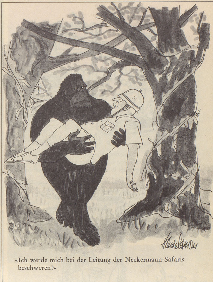
«Ich werde mich bei der Leitung der Neckermann-Safaris beschweren!»

überzeugte und zum Abzug bewegte. Sie hätte es auf eine diplomatische Art tun können, indem sie einfach wartete, bis es den Jungen zu dumm geworden wäre, unter den Bäumen herumsitzen. Die Basler Regierung tat es jedoch auf eine Art, die einen peinlichst an Vorgänge in totalitären Staaten erinnert. Sie tat es mit Gewalt bei Nacht und Nebel. Und zuvor drückte sie sich um die Wahrheit, daß es eine Schande war.