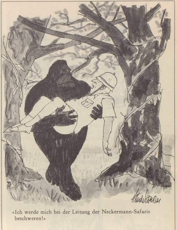
«Ich werde mich bei der Leitung der Neckermann-Safaris beschweren!»

überzeugte und zum Abzug bewegte. Sie hätte es auf eine diplomatische Art tun können, indem sie einfach wartete, bis es den Jungen zu dumm geworden wäre, unter den Bäumen herumsitzten. Die Basler Regierung tat es jedoch auf eine Art, die einen peinlichst an Vorgänge in totalitären Staaten erinnert. Sie tat es mit Gewalt bei Nacht und Nebel. Und zuvor drückte sie sich um die Wahrheit, daß es eine Schande war.