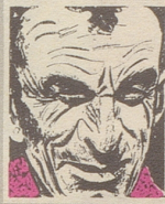
Us em Innerrhoder Witz- tröckli

«Heute hatte ich Pech», berichtet White. «Ich habe eine Frau auf der Straße geküßt und wurde verhaftet. Und als der Richter die Frau sah, verurteilte er mich zu zehn Dollar, weil ich betrunken gewesen sein muß.»