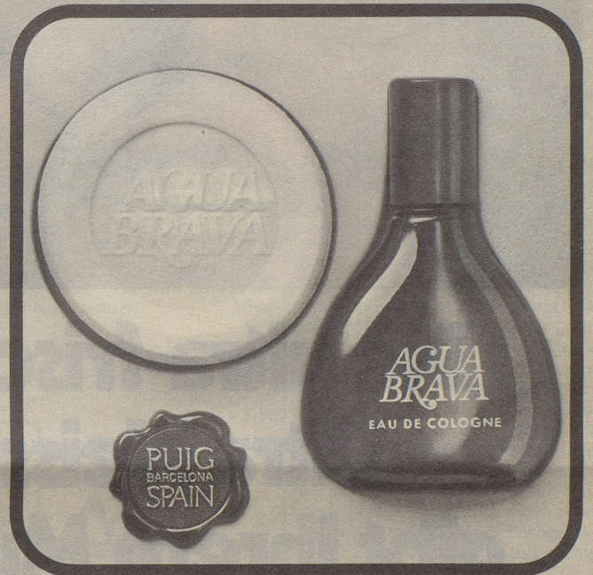
Abbildung in Original-Grösse