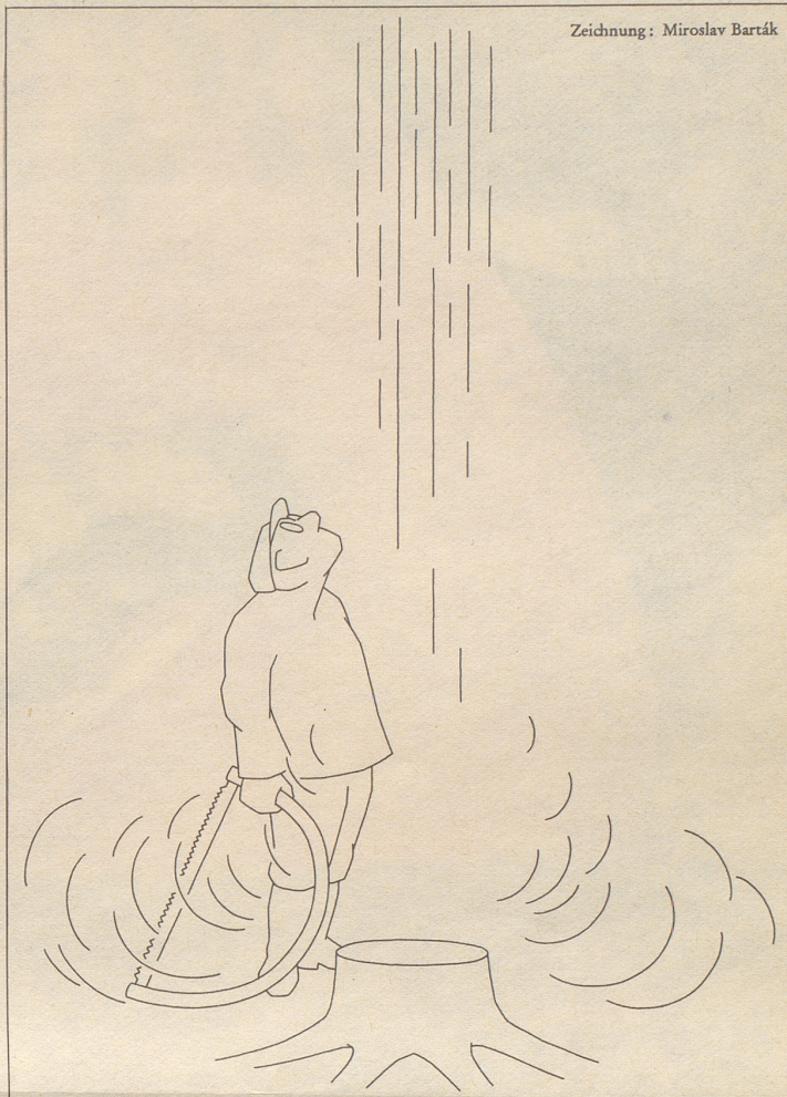
Zeichnung: Miroslav Barták

«Was hat meine Frau gesagt», fragt der Chef die Sekretärin, «als Sie ihr mitteilten, daß ich heute sehr spät heimkomme?» Und die Sekretärin erwidert: «Sie sagte: «Kann ich mich darauf verlassen?»»