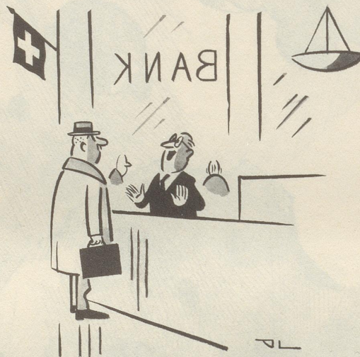
«Verzeihung, 109786432, ich verwechsle Sie immer mit 278438927, Sie sehen sich beide so ähnlich ...»