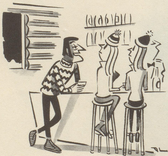
«Fremde kommen wegen dem Skilaufen. Wir Einheimischen kommen wegen dem Après-Ski.»