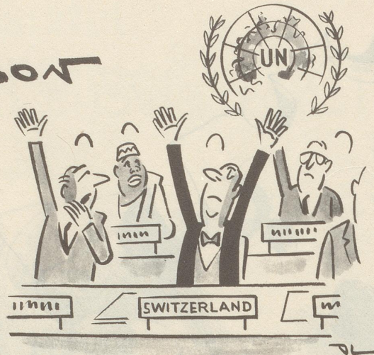
«Da er neutral ist, stimmt er dafür und dagegen ...»