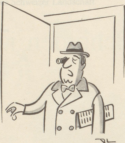
«Ich habe Feierabend, Liebling ...»