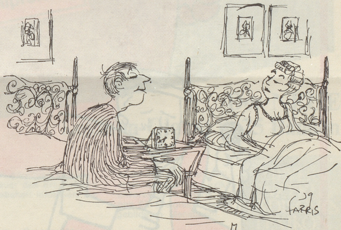
«Beim nächsten Bélièr-Streich darf ich auch eine Petarde werfen!»

Gesehen, gelesen und geknipst! Ein guter Bibelspruch, der in löblicher Absicht an diesen Baum geheftet wurde. Ob der Mann aus Ettingen auch etwas gedacht hat, als er seine Einladung zum Grümpel-Turnier unter Jakobus 4, 17 angeschlagen hatte! Werner Perrenoud