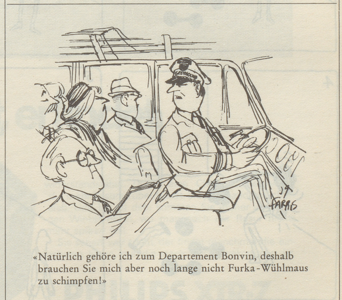
«Natürlich gehöre ich zum Departement Bonvin, deshalb brauchen Sie mich aber noch lange nicht Furka-Wühlmaus zu schimpfen!»