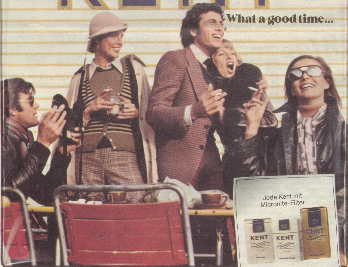
Lintas K 73/3