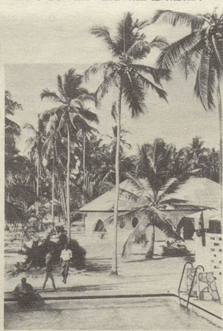
...und abends trifft man sich beim kalten Buffet vor dem Swimming-pool wieder. (Ohne Löwen.)

man immer in die Ferien möchte. Fräulein Lienhard hat sich Ostafrika zur zweiten Heimat gemacht. Sie kennt die schönsten Strände, die besten Geschäfte an der Kilindini Road und die «wirklichen» Preise im Indian Bazar.