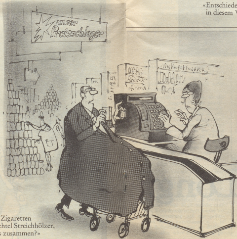
«Ein Päckchen Zigaretten und eine Schachtel Streichhölzer, was macht das zusammen?»