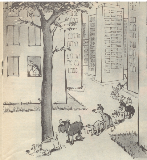
«Entsieden zu wenig Bäume in diesem Viertel!»