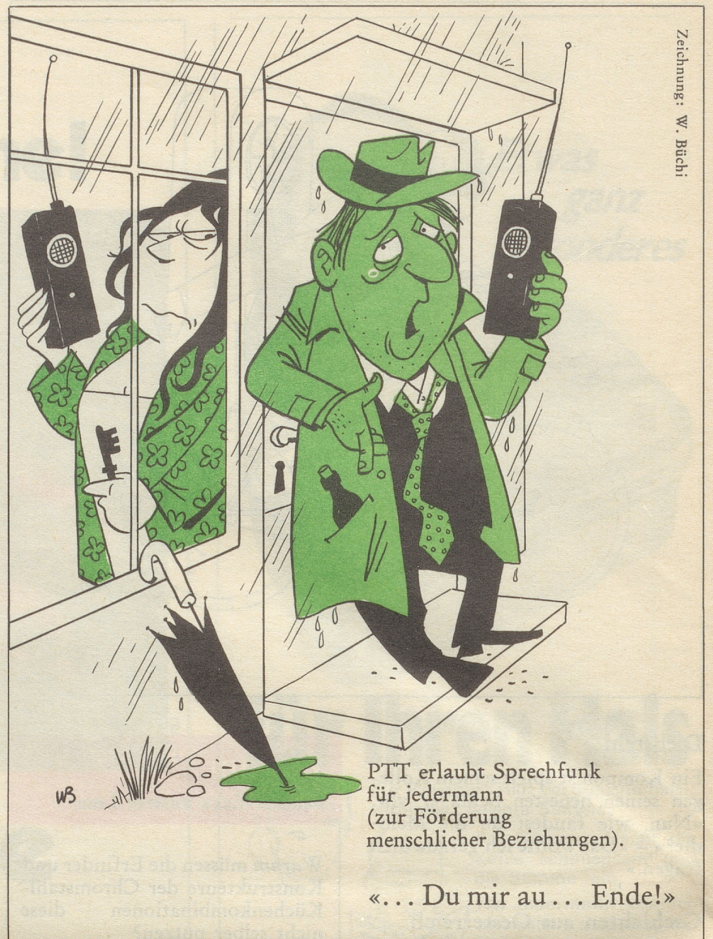
Zeichnung: W. Büchi

PTT erlaubt Sprechfunk für jedermann (zur Förderung menschlicher Beziehungen).