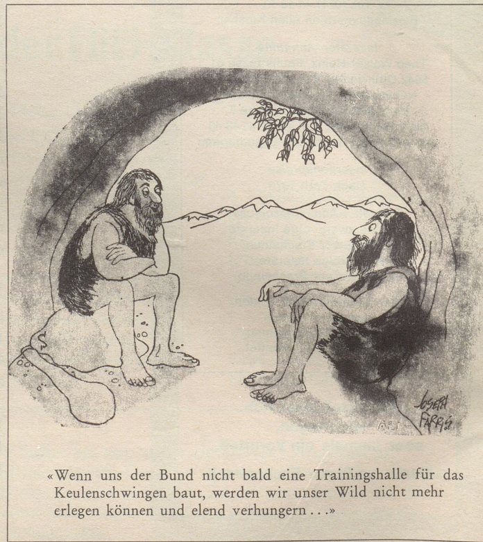
«Wenn uns der Bund nicht bald eine Trainingshalle für das Keulenschwingen baut, werden wir unser Wild nicht mehr erlegen können und elend verhungern...»

traut ist. Die Studiengruppe erwartet vom Delegierten, dass die Interessen der Erwachsenen bei allen Entscheidungen angemessen statt übertrieben berücksichtigt werden. Der Koordination und Intensivierung der Erwachsenenforschung soll grosse Bedeutung beigegeben werden, und der Bundesversammlung ist regelmässig über die Lage der älteren Generation zu berichten. Ernst P. Gerber