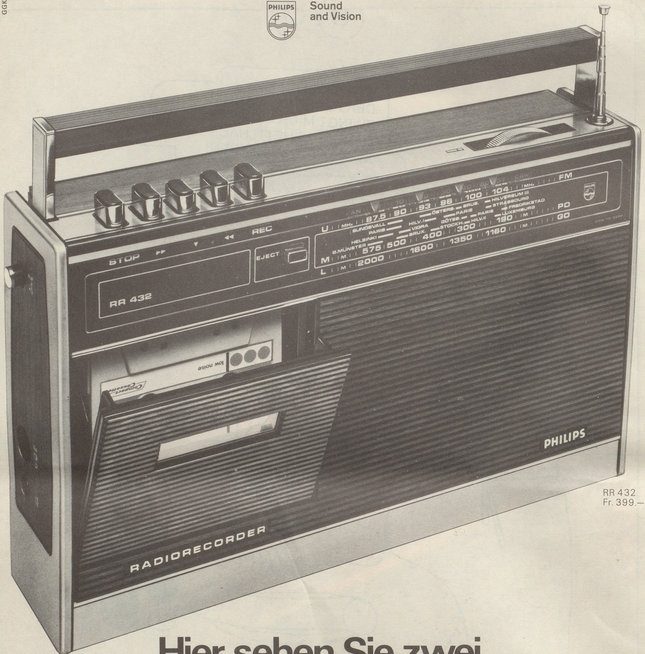
RR 432 Fr. 399.-