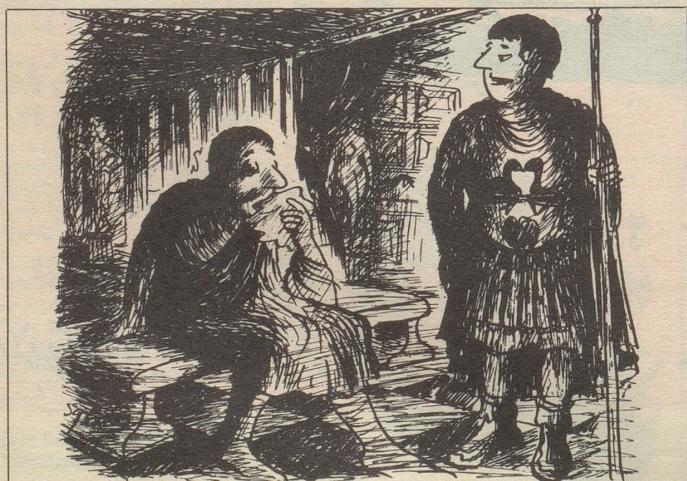
«Geduld, Geduld! Es ist nur eine Frage der Zeit, bis die Menschheit ein Mittel gegen den Schnupfen findet!»

Antwort: «Im Prinzip nein, aber wenn Sie schon fragen, werden Sie wohl bald mehr wissen.» H St