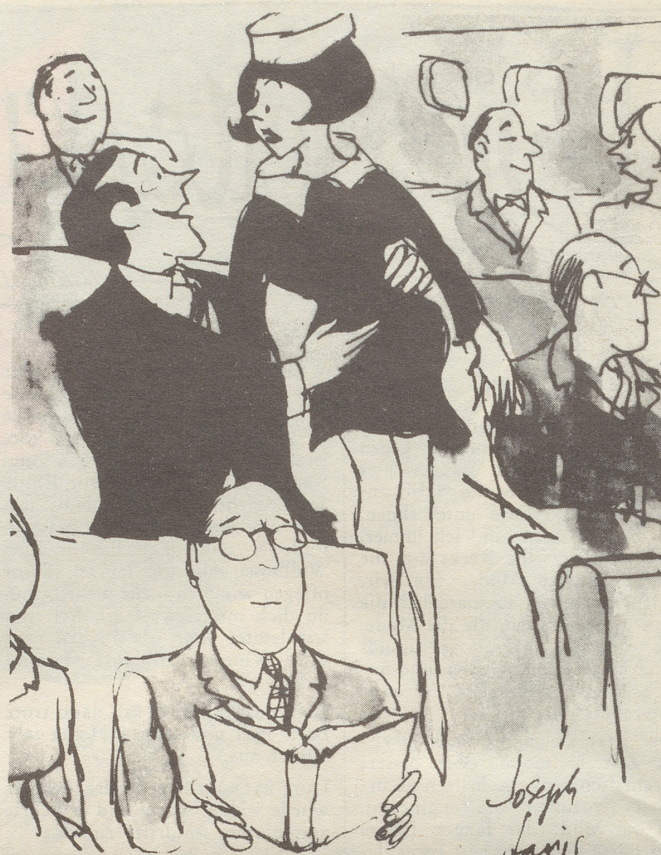
«... aber bitte, Fräulein... eben noch flüsternten Sie übers Mikrofon, wie glücklich Sie seien, dass ich mit der Swissair fliege»

Ein ganz ganz anderer Fall ist es, wenn umgekehrt ein Mami auch einmal in eine Notsituation gerät. Es würde mir nie (mehr) einfallen, die nette Lehrerin anzufragen, ob mein Kind bei der anderen Klassengruppe bleiben und seine Aufgaben dort im Klassenzimmer machen dürfte, etwa während einer