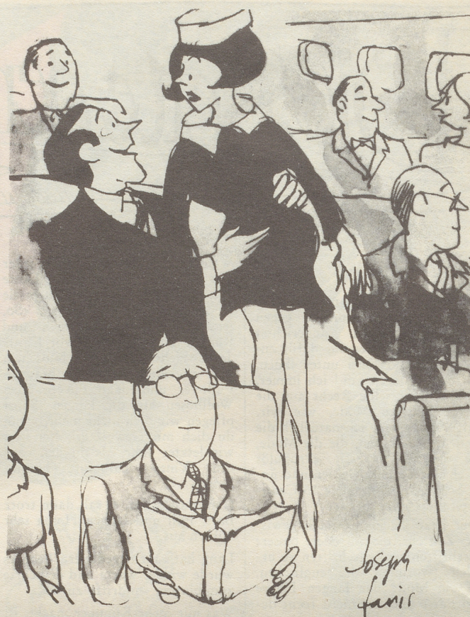
«... aber bitte, Fräulein... eben noch flüsternten Sie übers Mikrofon, wie glücklich Sie seien, dass ich mit der Swissair fliege»

Ein ganz ganz anderer Fall ist es, wenn umgekehrt ein Mami auch einmal in eine Notsituation gerät. Es würde mir nie (mehr) einfallen, die nette Lehrerin anzufragen, ob mein Kind bei der anderen Klassengruppe bleiben und seine Aufgaben dort im Klassenzimmer machen dürfte, etwa während einer