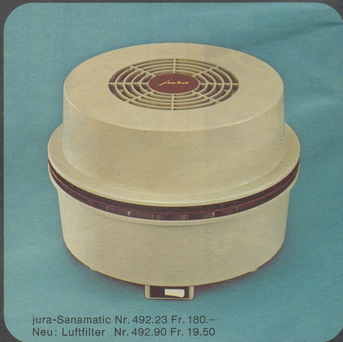
jura-Sanamatic Nr. 492.23 Fr. 180.– Neu: Luftfilter Nr. 492.90 Fr. 19.50