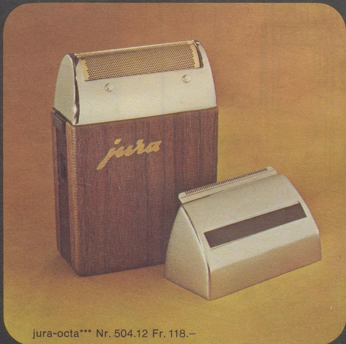
jura-octa*** Nr. 504.12 Fr. 118.–

sunde Luft zu haben. Mit dem jura-Sanamatic. Der jura-Sanamatic ist ein Luftreiniger und ein Luftbefeuchter. Das patentierte jura-Verdunster-System sorgt dafür, dass die Zimmerluft die richtige, gleichbleibende Feuchtigkeit erhält. Neu: zum jura-Sanamatic gibt es den Luftfilter, der die Luft reinigt, bevor sie befeuchtet wird. Mit dem jura-Sanamatic haben Sie gesunde, frische Schweizer Luft in allen Räumen – und zu jeder Zeit. Und das zu nur etwa 2 Rappen im Tag. Tun Sie etwas für die Gesundheit Ihrer Familie. Kaufen Sie den jura-Sanamatic.